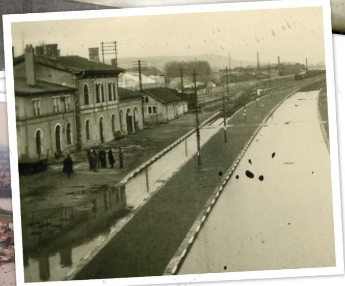
PAPI d'intention du bassin versant de la Moselle aval